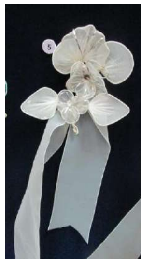
ЛМИК 76,64/РОА 16