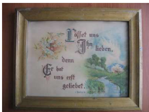
ЛМИК 8375/РОА 7