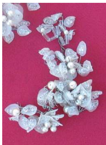
ЛМИК 74,5/РОА 12