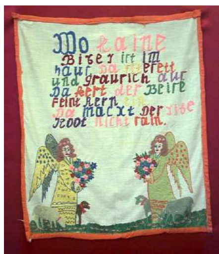
ЛМИК 635/ТН 329