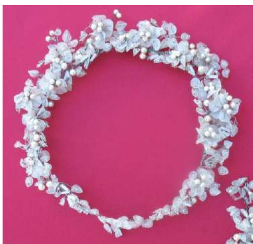
ЛМИК 74,4/РОА 11