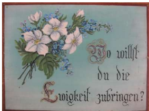
ЛМИК 8369/РОА 1