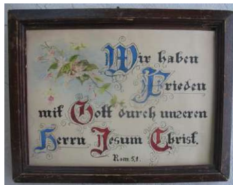
ЛМИК 8370/РОА 2