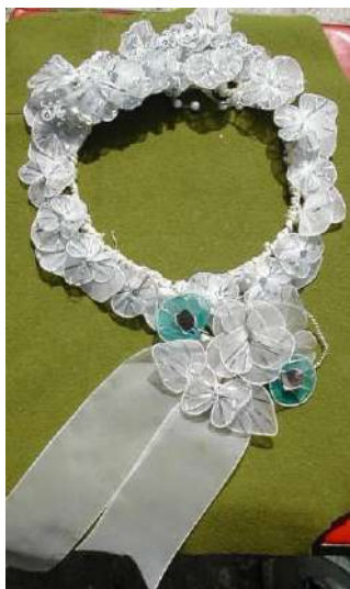
ЛМИК 76,66/РОА 18