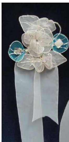
ЛМИК 76,62/РОА 14