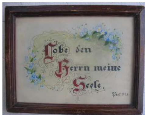
ЛМИК 8373/РОА 5